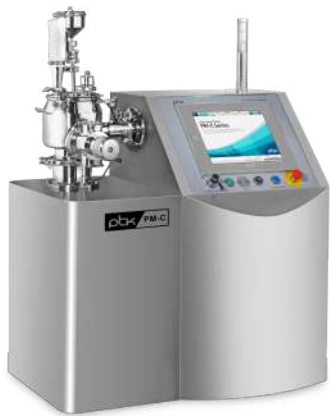
High Speed Mixer