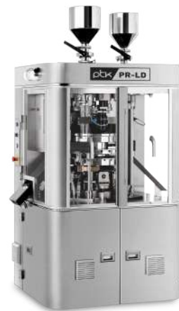
Rotary Tablet Press