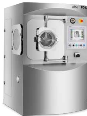
Automatic Coating Machine (Film Coating)